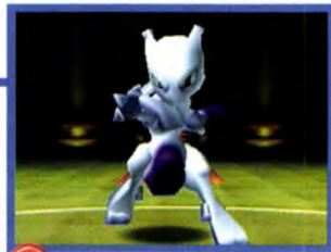
↑ こんなポケモンも使えるぞ