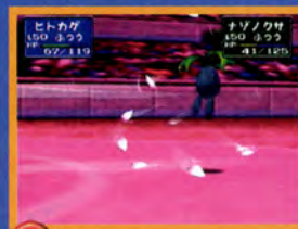
↑ すぐにバトルができるぞ