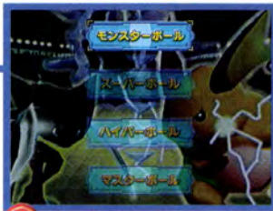
↑ コンピュータの手強さもいい感じ

えは満点だ。中でもレベル無制限の「ウルトラカップ」は、かなり楽しめることうけあいだ。ぜひマスターボールカップまで勝ち進んでもらいたい。