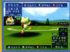
↑ 時間を決めてパシッとバトルするにはもってこいだね

ここは友達との対戦専用モード。「しあじかん」と「わざをきめるじかん」を設定して楽しむことができるぞ。特に「わざをきめるじかん」を短く設定してバトルすると、かなりの緊張感で楽しむことができるんだ。