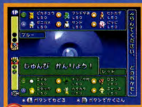
↑ チームが用意されているぞ

1Pならコンピュータと2Pなら友達とバトルすることができるぞ。まずはここで遊ぼう。