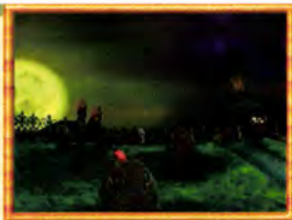
マッドナイト まんしょん入口