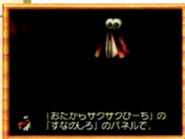
「おたからサクサクルーチ」の「すなのしろ」のパネルで、 チートコード