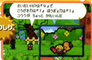
↑ クリオの特技は「ものしり」。敵のステータスがわかってちゃうぞ