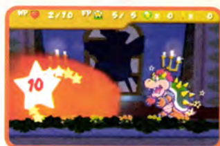
↑ クッパに邪魔されてしまいました。しかも強いよクッパ!