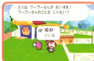
↑ナゾの生物プーピーさんを購入できる。これって何だろう?