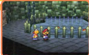
とにかく前に前にと進んでこう

カメキを仲間に加えて、いよいよ岩に進入。カラフルなノコノコ、ノコブロス達はここに「星のせい」のひとりをつままえているみたいなんだ。城内は敵もいっぱいいるので、回復系のアイテムを持っていくことを忘れないようしよう。