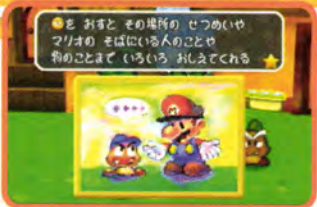
↑ クリボーのクリオが仲間になりました。2人でがんばろ～

クリしい愛用のハンマーをゲットしたマリオに、今度は孫のクリオからの提案が。なんと、クリオがマリオの仲間になってくれるとのこと。仲間がいればマリオだって心強いよね。それでは、クリオとともにキノコタウンに戻りましょう。次はマロンロードだ。