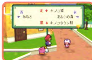
↑町の標識もちゃんとみておこう。詳しいマップは来月掲載だ