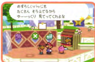
↑バッジ屋さんがオープン。コインで購入することができるぞ

●実はこんなに広いでした ノコブスを倒してキノコタウンに戻ってくると、かなり復旧が進んでいて、町のいろんな所に行けるようになっているぞ。バッジ屋さんなどもオープンしているので、まずは町をゆっくり見て回ってみよう。新発見があるかもよ。