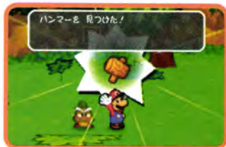
↑ クリしいからハンマーをもらうことができたぞ。これで先に進めるのだ