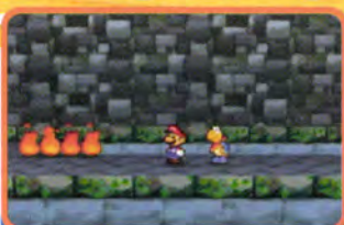
出ました。マリオならおなじみのファイアー。ジャンプでかわそう