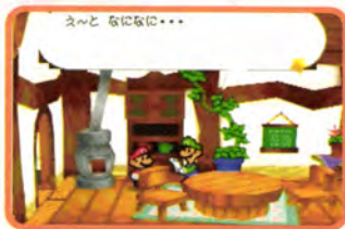
↑ ピーチ姫からの招待状でキノコ城に向かうマリオとルイージ

ピーチ姫からの招待状でキノコ城に向かったマリオ。ところが突然現れたクッパの前にコテンパンにやられてしまい…。というところまでは先月号までのお話だったよね。さて、いよいよ今回からはマリオの反撃がスタート。打倒クッパの精神でがんばりましょう。