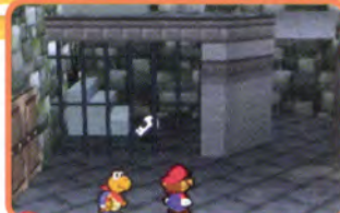
あのカギはどうやって取るのかな?