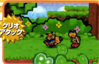
↑ クリオの攻撃は頭突きです。空中の敵も攻撃できちゃうんだ