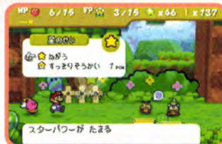
↑「わがう」を使えばゲージのたまる量がちょっと多くなるんだ

「星のせい」を救出したら、戦闘画面の左上を注目。ここに新しいゲージが追加されているぞ。さらに、戦闘のコマンドにも「星のせい」が追加されている。このゲージがたまれば「星のせい」コマンドが使用可能だ。ゲージはマリオのターンごとに少しずつたまるぞ。