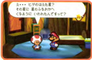
↑ マリオが目覚めるとそこはクリ村のキノピオハウスでした

クッパの攻撃に大ピンチに陥ったマリオだったんだけど、「星のせい」の助けによってクリ村で目覚められた。ん?!「星のせい」って誰?! どうやら今回の物語はこの「星のせい」をめぐる冒険になっていきそうなんだ。オープニングをしっかり見ておこう。