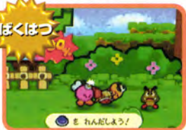
「ぼくはつ」はAボタン連打だ