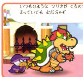
↑だってクッパはピーチ姫に頭があがらないからね

の秘密は来月号で紹介しちゃうけど、ピーチ姫のファンなら絶対うれしいはず。ある意味マリオより目立っている?!かもよ。