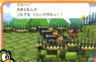
まずはキラーを使ったバトルが。うまくかわしていこう

そしていよいよノコブロスと対戦。実は最初のバトルでは、とんでもない姿で現れるのだ。