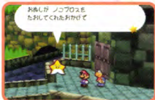
↑「星のせい」を助け出したマリオ。あと6人を救出するのだ

ノコブスを倒すとステージクリア!!。捕らわれたいた「星のせい」を救出することができるぞ。この「星のせい」を救出すると、バトルでも役に立つ力を授けてもらえるんだ。残る「星のせい」はあと6人だ。長い道のりだけど、がんばっていこう。