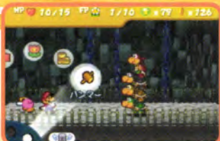
ノコブロス本体と対戦。こんなに重なっています。ってことは…