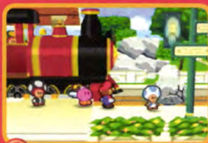
↑汽車が登場。もち、乗れますよ

さて、この後の物語は急展開を迎えるぞ。残り6人の「星のせい」を救出して、クッパに対抗すべく力を得なくちゃいけないからね。では来月号のハイライトをちょっとだけ紹介しておこう。