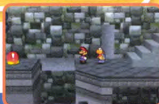
あの向こうにあるスイッチはカメキを使って押そう