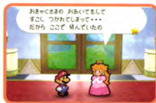
↑ せっかくのピーチ姫との楽しいひとときなんだけど…