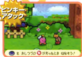
通常攻撃はAを押して続けて離す

った壁などは、ピンキーが破壊してくれるぞ。バトルでもつよ〜し味方になってくれるので大助かりだ。