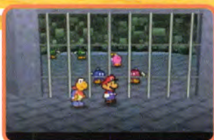
檻の中にはボム兵たちが捕らわれていてみたいんだけど…

岩の最初の方に檻に入ったカギとかがあるんだけど、これはまだ取れないのでほうっておこう。とにかく前に進めるだけ進んで、後で考えてもOKだ。城内の敵は一度倒すと、岩を出ない限り復活しないので、先に倒しておくのがいいぞ。レベルアップもしたいしね。