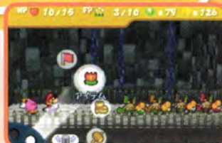
うまく彼らをひっくり返せればかなり楽に戦えるんじゃない?