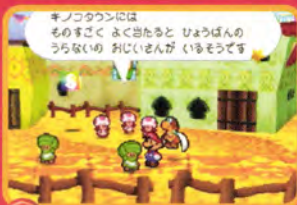
↑なにやらサバクっぽい雰囲気