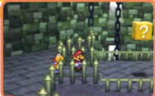
いかにも怪しいブロックだけど…