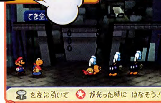
↑ このノコノコもマリオを助けしてくれるみたい