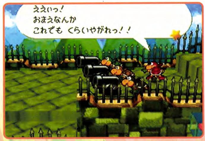
↑ このカラフルなノコノコ軍団は一体?! キラーを操作していたのはこいつらだったのか?! このレインボーノコノコ部隊は一体、誰の命令でマリオを妨害してるのかな