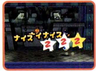
↑ 攻撃はアクションでタイミングよくやれば、この通り