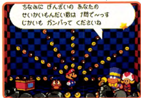
↑ なんと、いきなりクイズが始まっているんですけど...