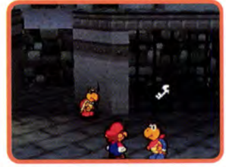
↑ あのカギが欲しいよね。どうやったら ゲットできるのかな