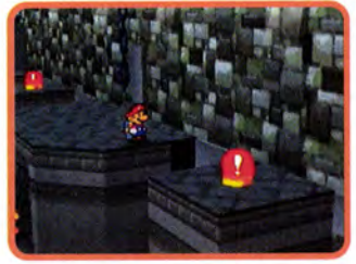
↑ この高いところにあるスイッチはどう やっていれるのかな