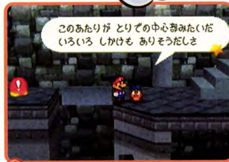
↑ 一緒に冒険してくれる物知りクリボーが登場